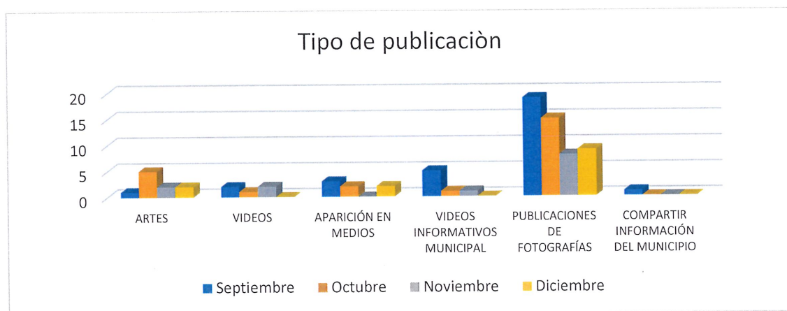
Tabla 1: informe semestral, difusión y comunicación

En la actualidad son las redes sociales las más vistas, y de fácil acceso por ello una estrategia implementada ha sido la publicación de fotografías con información condensada, y videos en formatos de fácil reproducción en cualquier medio digital, esto con el fin de que la ciudadanía conozca y acceda a los servicios que como institución ofrecemos en garantía de los Derechos.